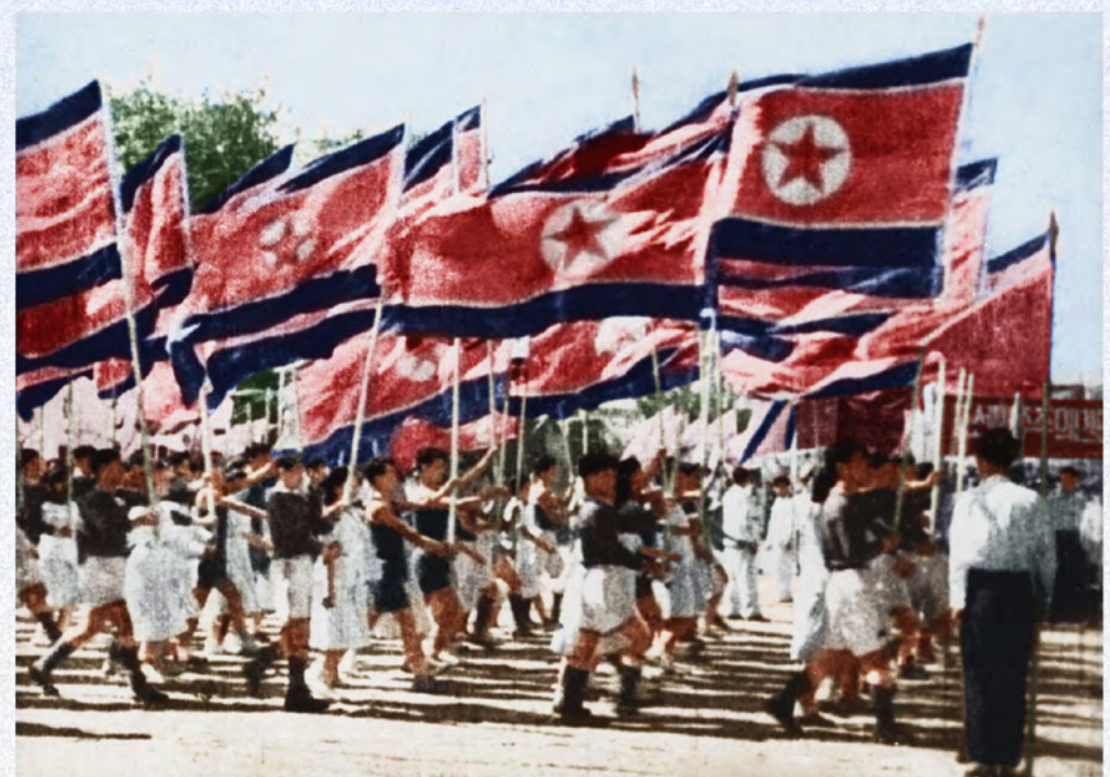
朝鲜民主主义人民共和国的成立给劳动人民群众带来了当家做主的骄傲和喜悦