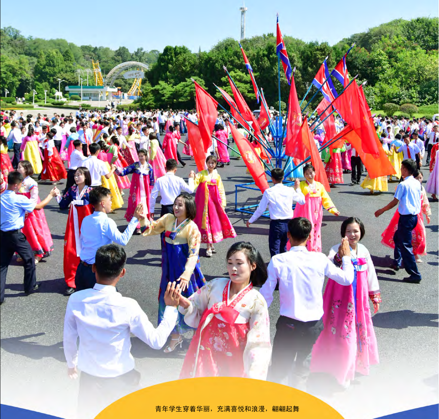
青年学生穿着华丽，充满喜悦和浪漫，翩翩起舞

首都平壤等各地进行了庆祝青年节的演出、青年学生的舞会、丰富多彩的体育及游戏娱乐比赛