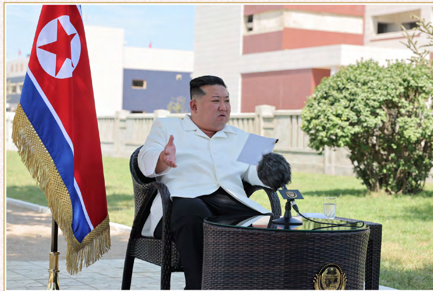
金正恩同志指出，我们党坚信人民军的忠诚和战斗力，交给人民军靠自力打开地方变革的庞大而神圣的历史工程。他提出了在光荣的建设大战中高度发挥我国军队威力的各项任务。

他强调，在我们党提出的中长期斗争的前头建树丰功伟绩的每一个军人都是无比宝贵的革命战士。党和政府的领导干部和军部指挥员要为给军人建设者提供更圆满的工作条件、文明卫生的生活条件而诚心诚意做出全方位的努力。