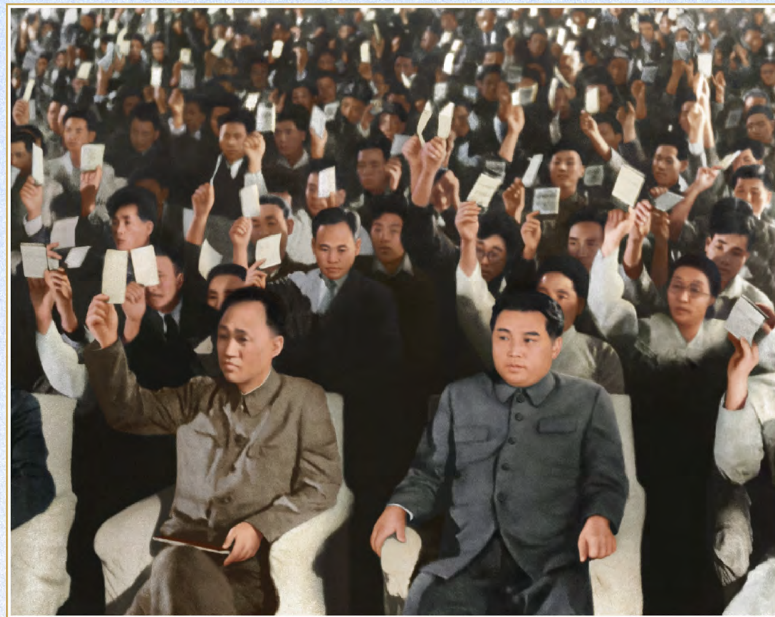
伟大领袖金日成同志在朝鲜民主主义人民共和国最高人民会议第一次会议上当选为内阁首相。1948年9月

金日成同志早年胸怀壮志，要建设一个真正属于人民的国家、属于人民的政权，在进行解放祖国的武装斗争初期，在游击根据地建立全新形式的人民革命政府，创造了人民政权建设的宝贵经验。