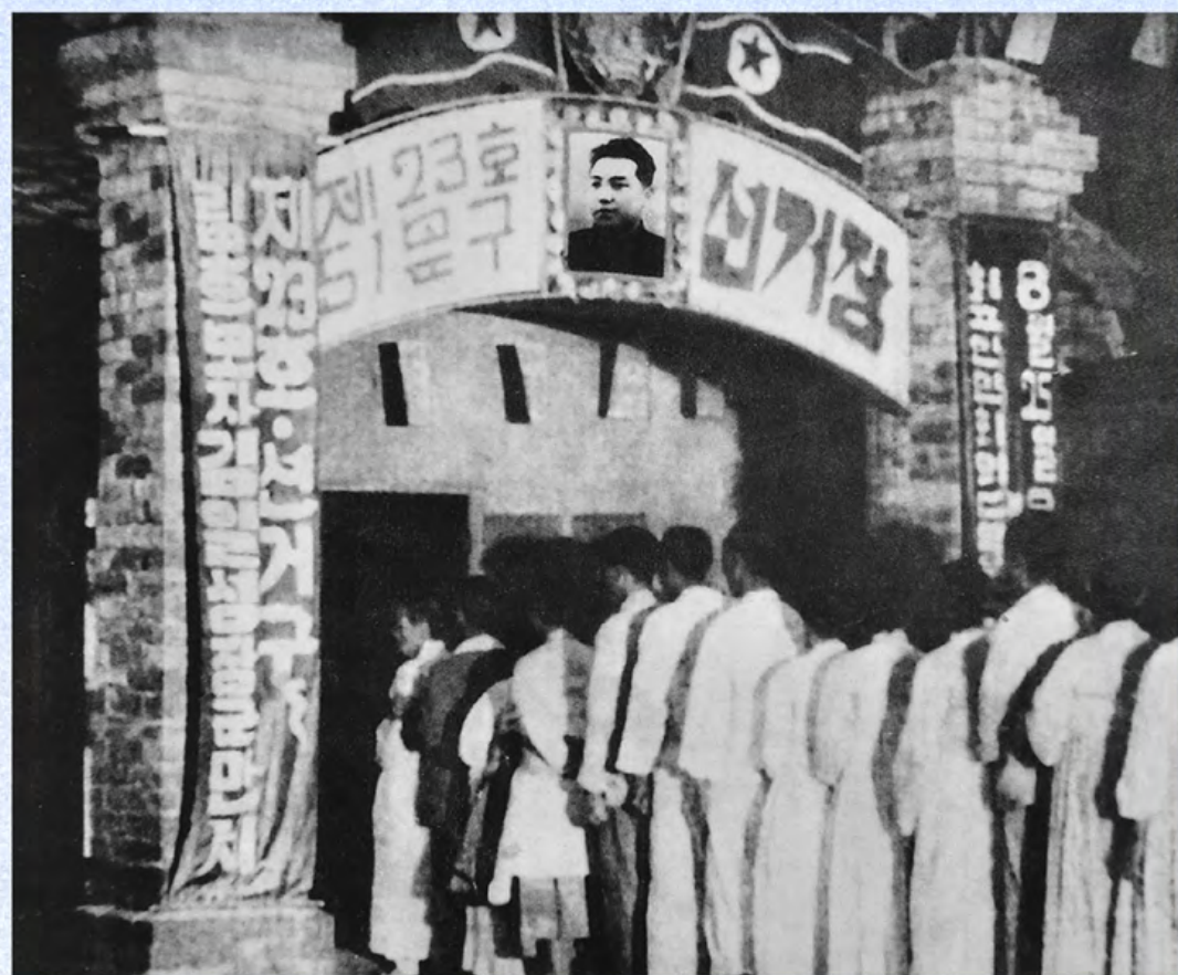
最高人民会议议员选举投票站 1948年8月