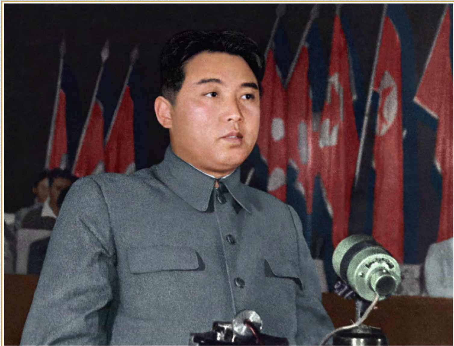
伟大领袖金日成同志在朝鲜民主主义人民共和国最高人民会议第一次会议上发表共和国政府纲领。1948年9月