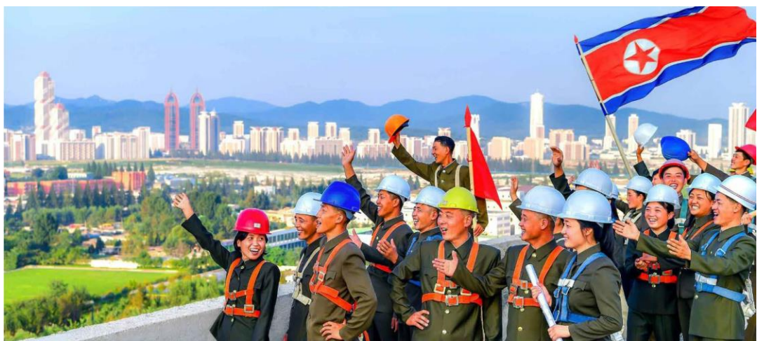
青年们结束住房骨架建设工程，人人喜气洋洋。