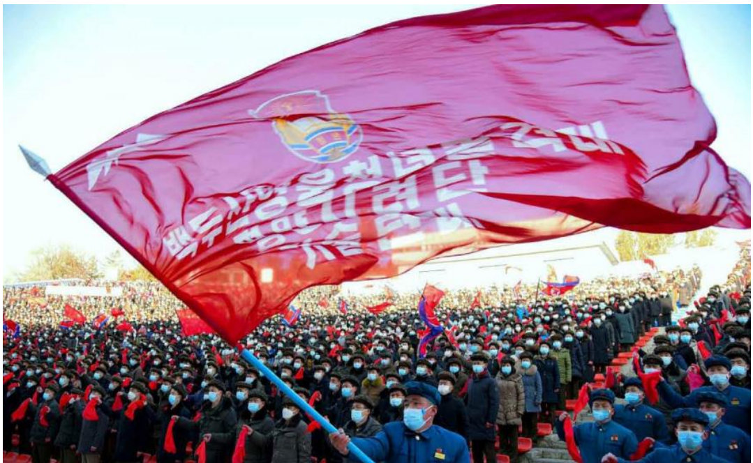
全国各地青年自愿奔赴首都平壤的新大街建筑工地。