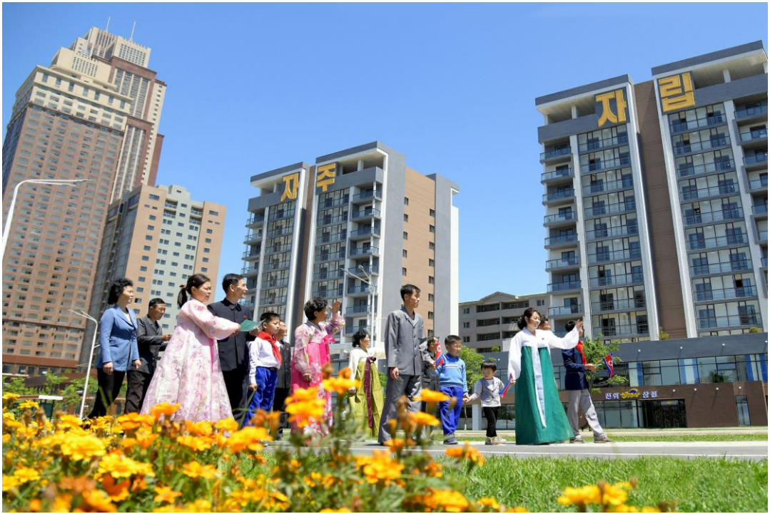
人民迁入凝聚青年建设者殊勋的新居。