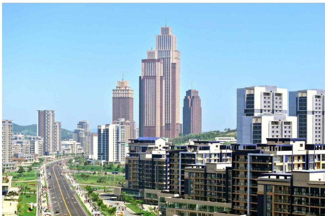
现代化的前卫大街