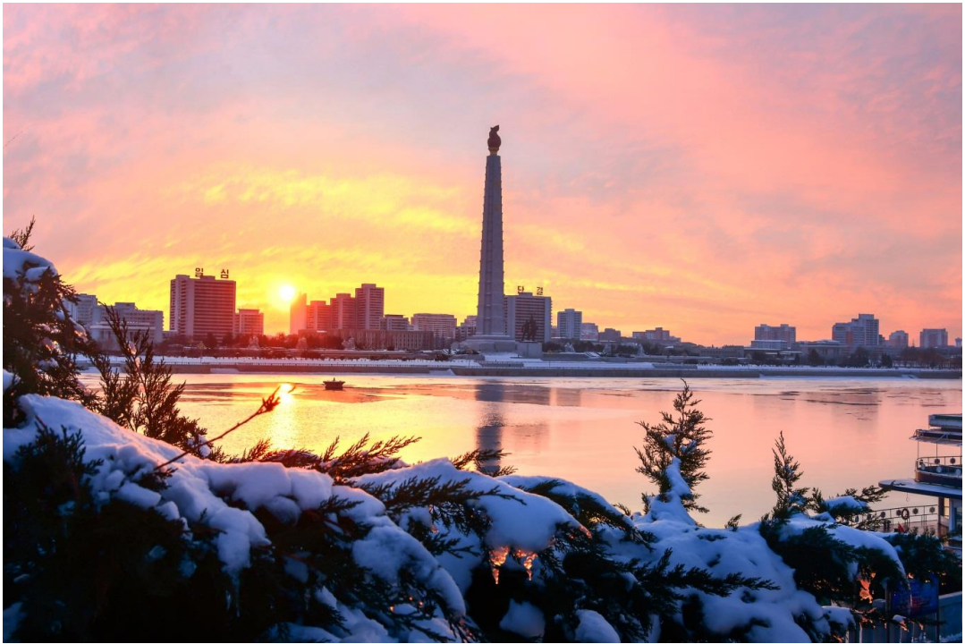
旭日东升的大同江畔，雪景可观。