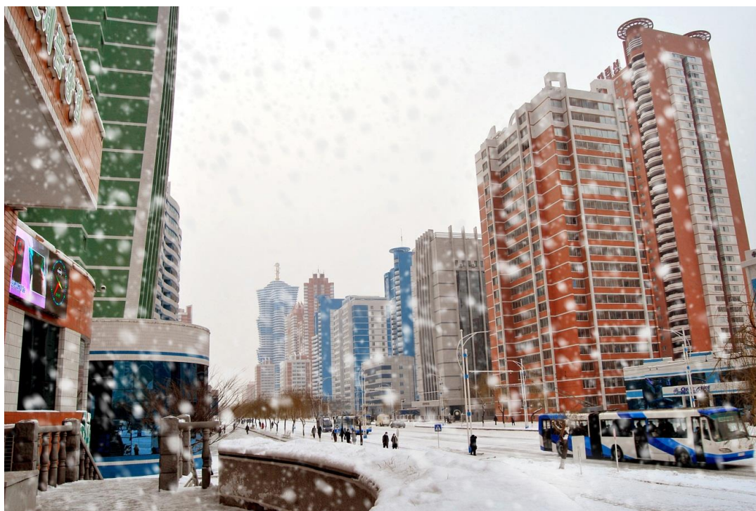
雪花飘落的未来科学家大街