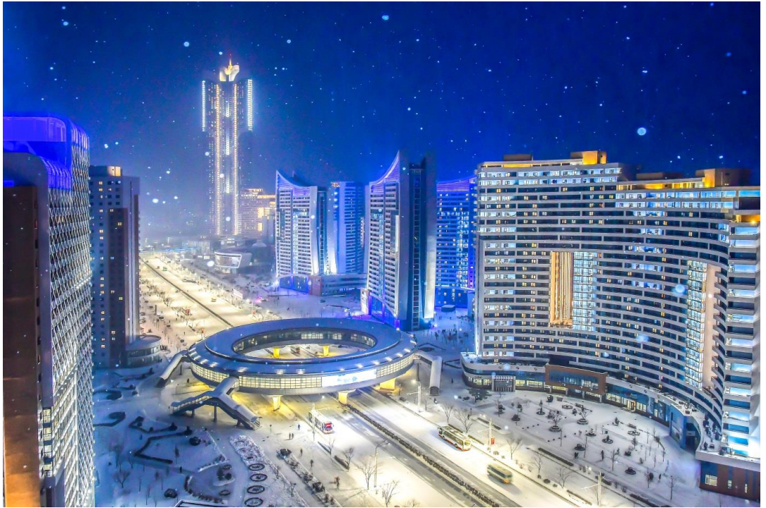
夜晚的松花大街上雪花飘落。