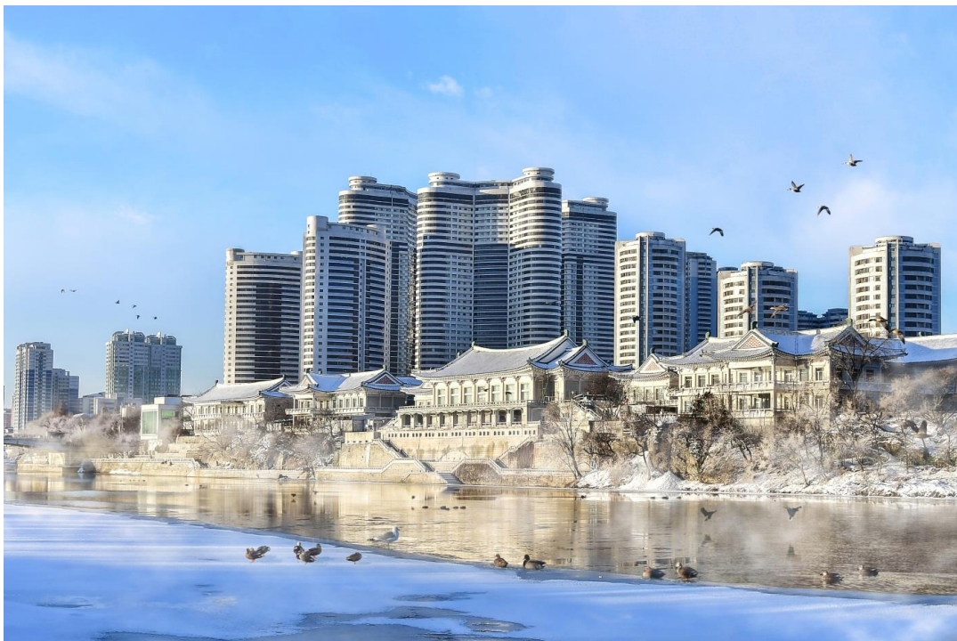
水鸭群点缀大同江畔风景，玉流馆的雪景吸引眼球。