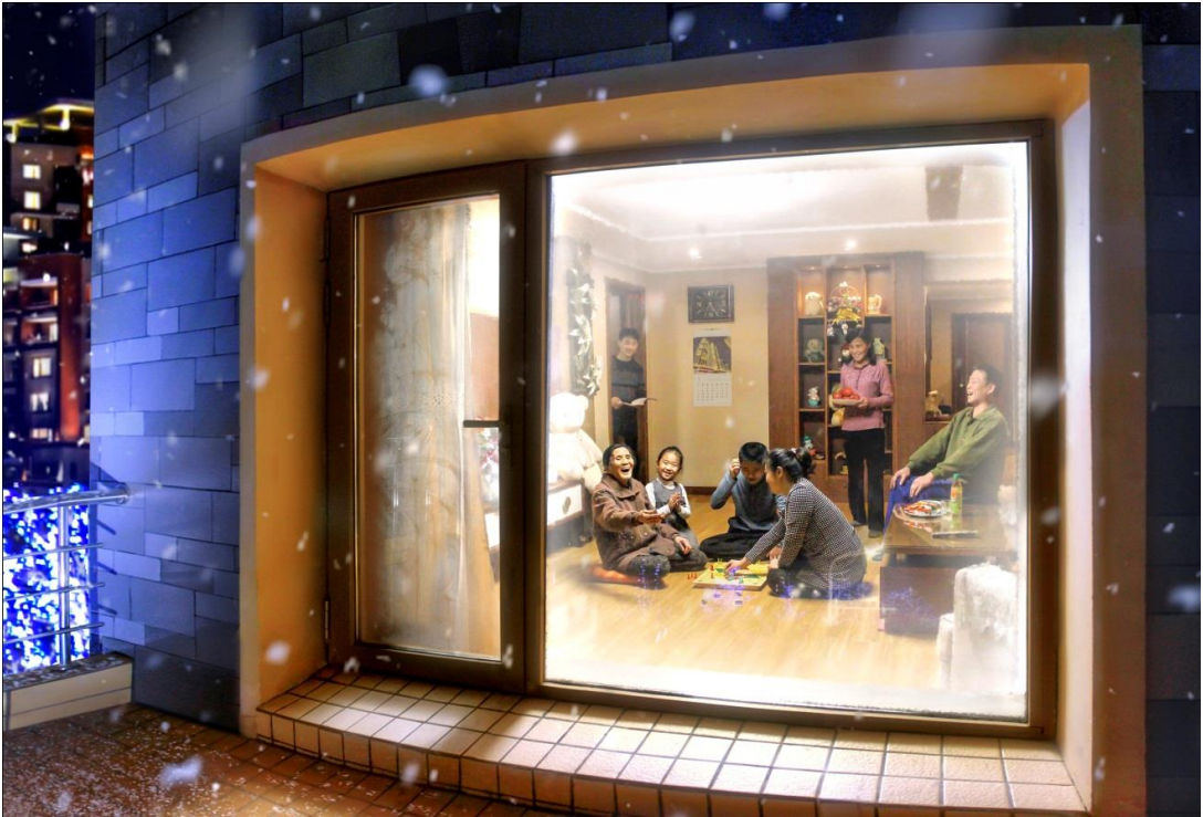
晚上，琼楼洞的一家人欢度时光。