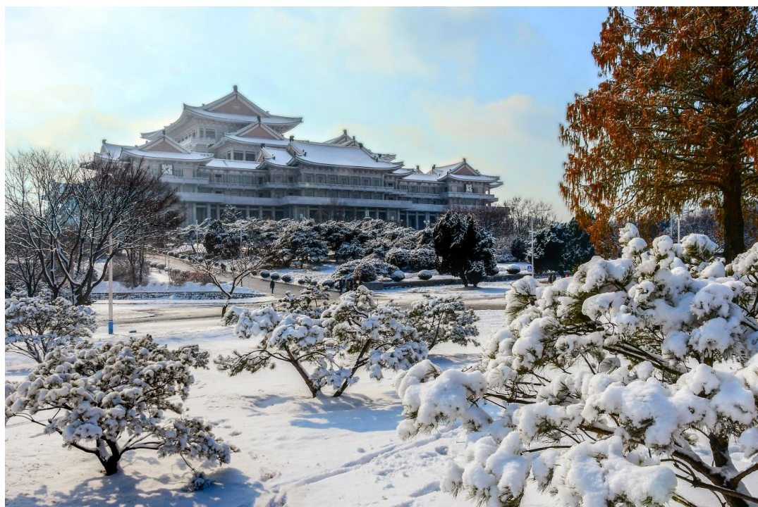
全民学习的大殿堂——人民大学习堂