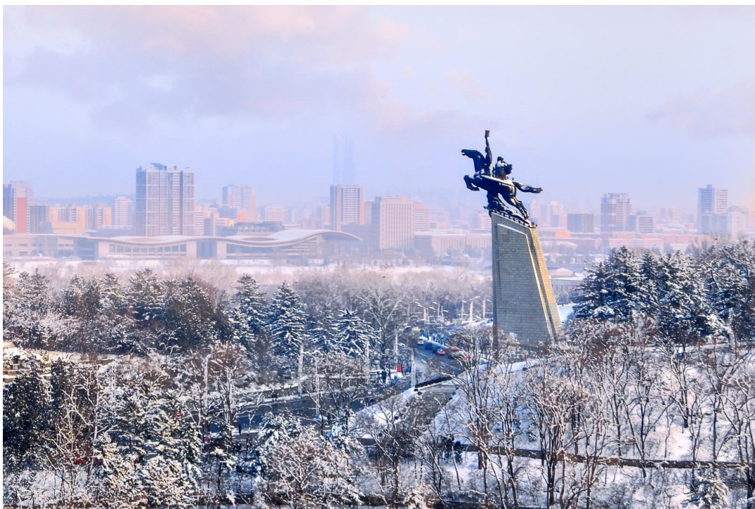
在千里马铜像的衬托下，平壤雪景更加美丽。