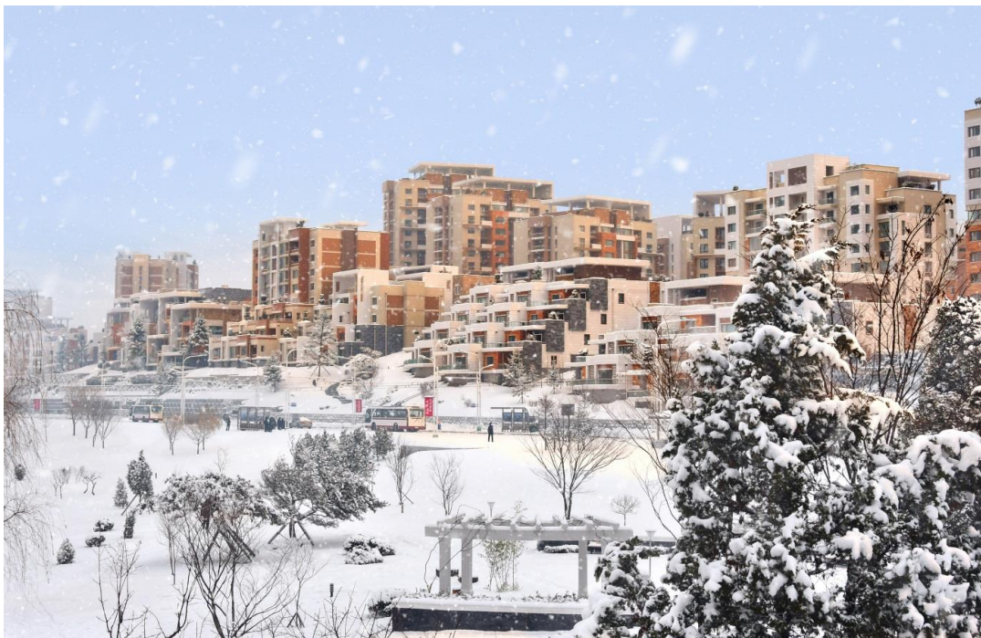
普通江岸楼梯式住宅区的雪景