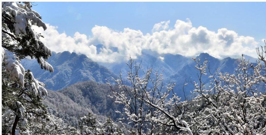
白云缭绕的妙香山雪景