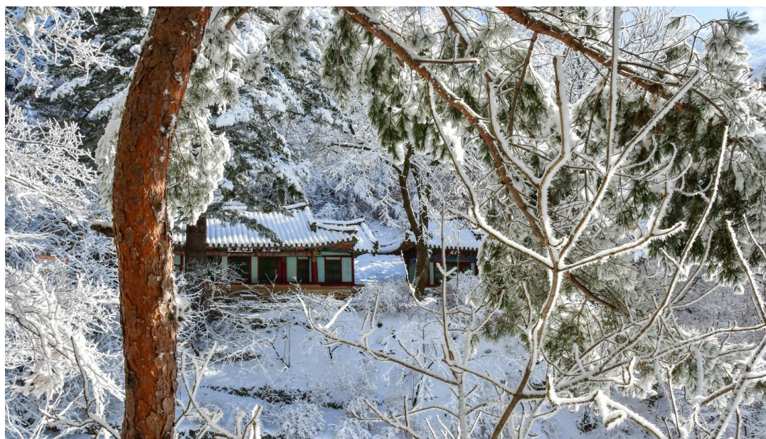
白雪覆盖的上元庵