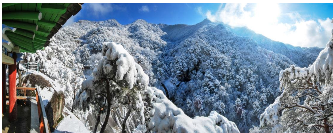
在引虎台眺望上元洞雪景。