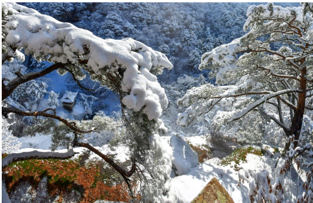
白雪覆盖的上元洞