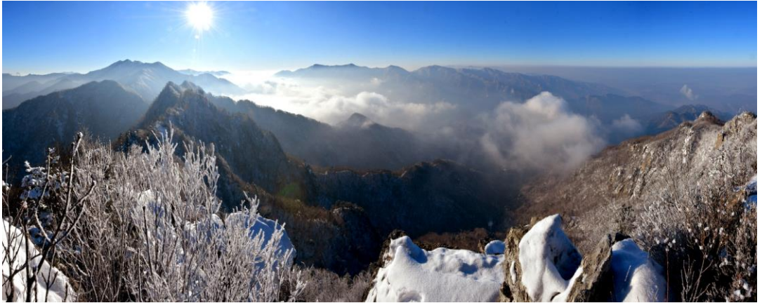
在法王峰远眺早晨的妙香山。